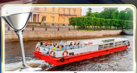
ล่องเรือแม่น้ำวอวา พร้อมลิ้ม Vodka Tasting

📅 เดินทาง : 14-21 มิ.ย.69 / 28 มิ.ย.-05 ก.ค.69 / 24-31 ก.ค.69