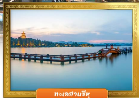
ทะเลสาบซีหู