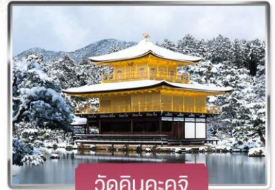
วัดคินคะคุจิ