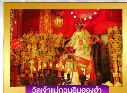
วัดเจ้าแม่กวนอิมฮองฮ่า