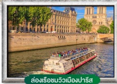
ล่องเรือชมวิวเมืองปารีส