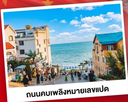
ถนนคอปเปลิงหมายเลขแปด