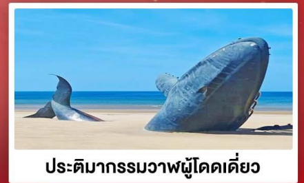
ประติมากรรมวาฬผู้โดดเดี่ยว