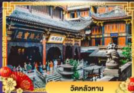
วัดหลิวหนาน