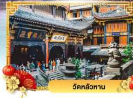
วัดหลัวหนาน