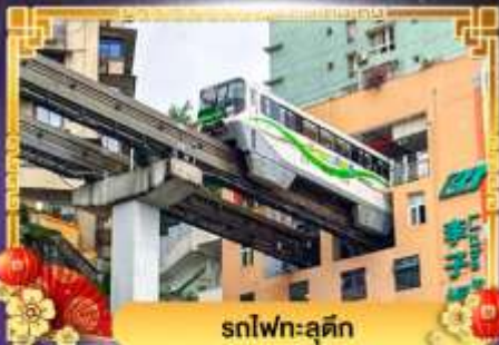
รถไฟฟ้า-ลู่ตีก