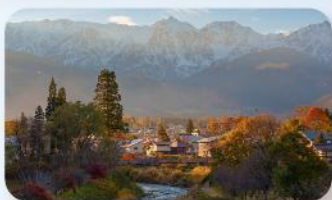
โออิเดะ ปาร์ค