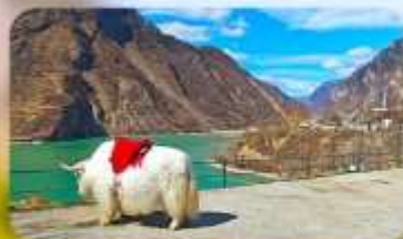
กะเลสาบเต๋อซี