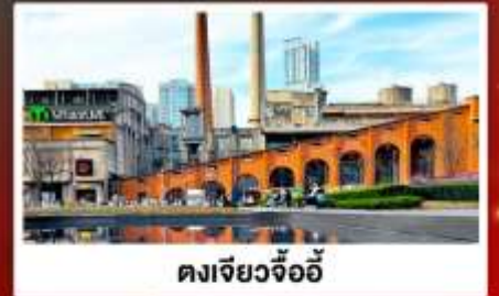
ตงเจียวจื่ออี้

🚄 นั้่งรถไฟความเร็วสูง รวมรถขบวนกระบะเป้