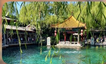
พิพิธภัณฑ์เบียร์ซิงเต่า