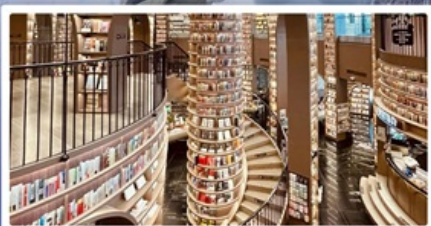
ร้านหนังสือจุงชูก่อ