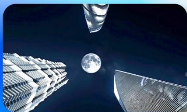
ลู่เจียซุย