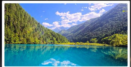
จิ่งจ้ายโกว