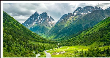
สี่ดรุณี