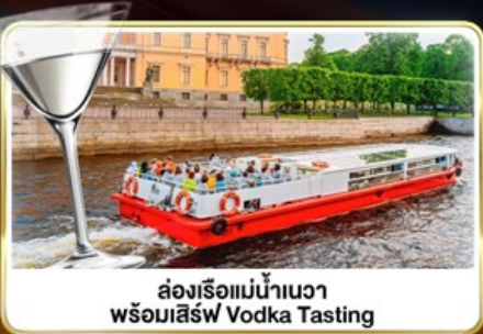
ส่องเรือแม่น้ำเนวา พร้อมเสิร์ฟ Vodka Tasting