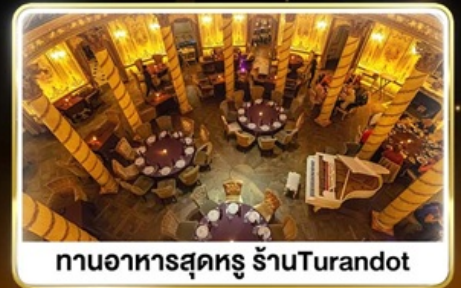
ทานอาหารสุดหรู ภัตตาคาร Turandot