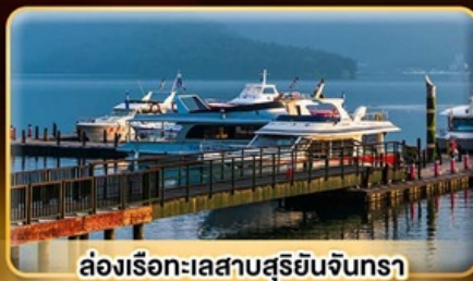
ล่องเรือทะเลสาบสุริยจันทราร