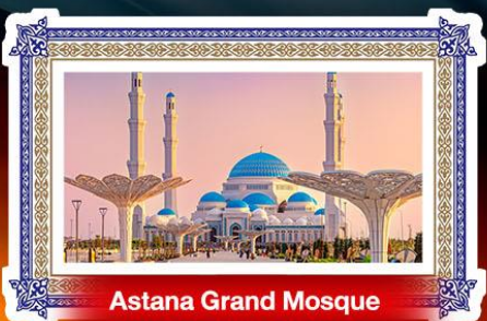
Astana Grand Mosque

85,999.- ราคาเริ่มต้น ✈️เดินทาง : 20-27 ก.ย. 69