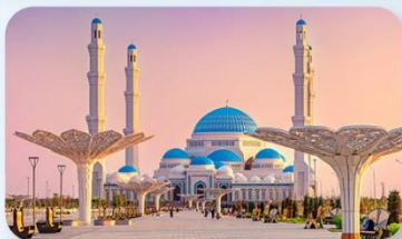
Astana Grand Mosque