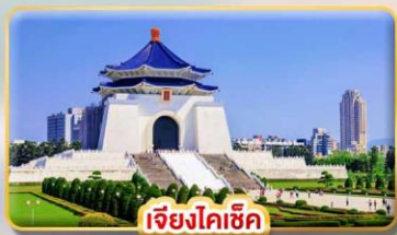
เจียงโคเช็ค