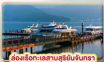
ส่องเรือทะเลสาบสุริยอันจินทรา