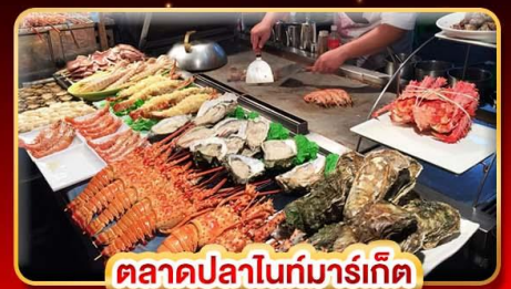
ตลาดปลาไนท์มาร์เก็ต