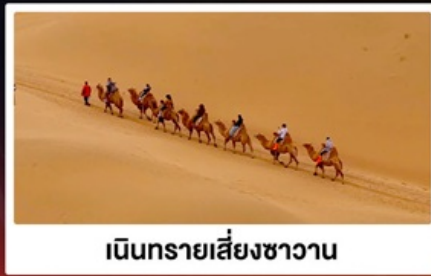
เนินทรายเลี้ยงชวาาน