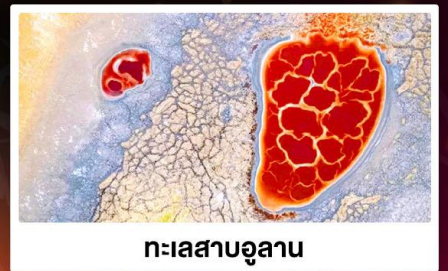
ทะเลสาบอูลาน