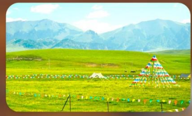
ทุ่งหญ้าออร์คอส