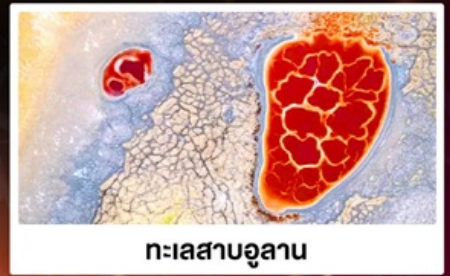
ทะเลสาบอูแลาน