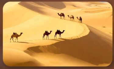
เนินทรายสี่งชวาน