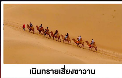
เป็นทรายเสียงขาวาน