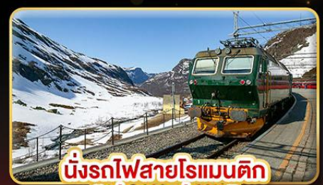
นั่งรถไฟสายโรแมนติก “พร้อมสปา”