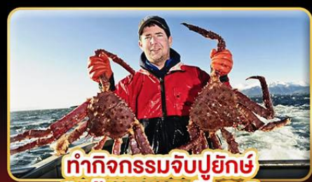
ทำกิจกรรมจับปูยักษ์ “พร้อมเมนูสุดพิเศษ”