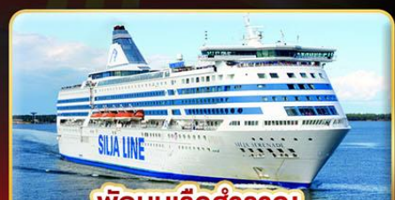
พักบนเรือสำราญ แบบ Window Room 2 คืน