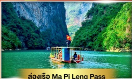
ล่องเรือ Ma Pi Leng Pass

เส้นทางเปิดใหม่ ฮายาง เช็กอินเมืองตามด้าว "เวียดนามฟีลยุโรป"