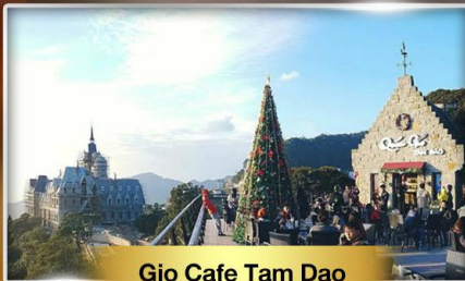
Gio Cafe Tam Dao