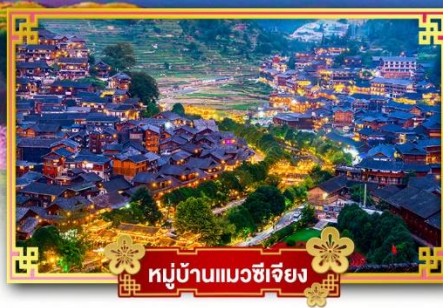
หมู่บ้านแม้วซีเจียง