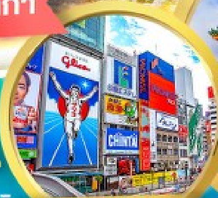
ชินโซบาสี