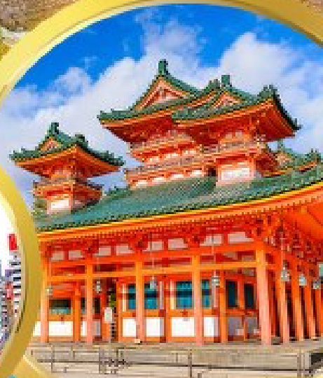
ศาลเจ้าฮอวัน

ชมความงามธรรมชาติ ณ อุทยานคามิโคจิ ชมปราสาทฮิกาตsuma ณ ปราสาทมิตสึโมโตะ ใช้รถทุกวัน ไม่มีวันอิสระ