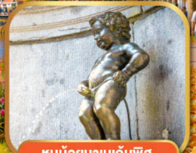
หนูน้อยมานเทินพิส