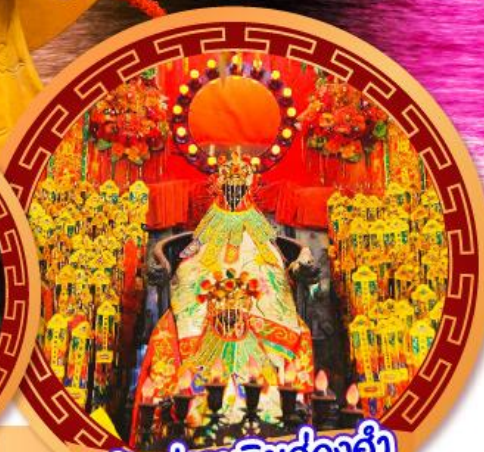
เจ้าแม่กวนอิมฮ่องฮำ

นมัสการเจ้าแม่กวนอิมฮ่องฮำ หมุนกั้งหันรับโชคลากเงินทองที่วัดแชกงหมิว ขอพรความรักกับผู้เต่าจันตรา วัดหวังต้าเซียน