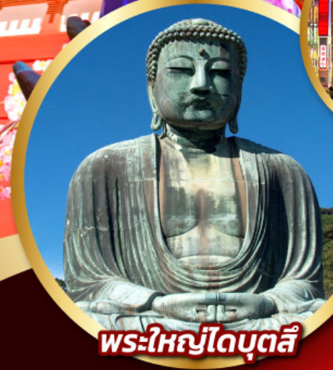
พระใหญ่ไดบุตสึ