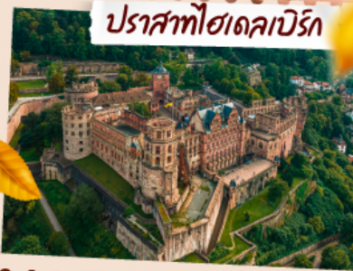
ปราสาทฮาเดเคบิร์ก