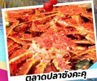
ตลาดปลาซังคะคุ