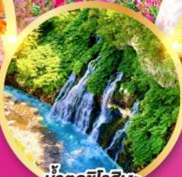
น้ำตกชิโรอิเงะ