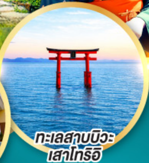
ทะเลสาบบิวะ เสาโทริอิ

เส้นทางสายอัลไพน์ทากายามา กำแพงหิมะ เพื่อนคู่โรเบะ