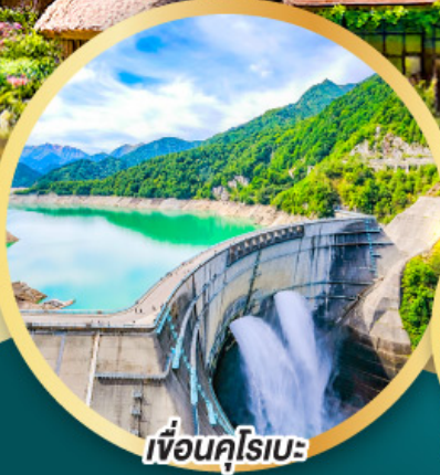
เพื่อนคู่โรเบะ