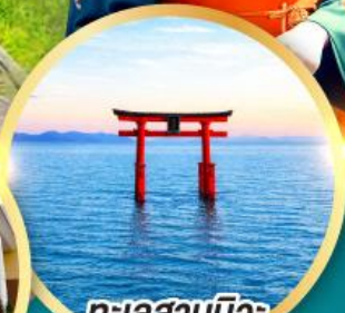
ทะเลสาบบิวะ เสาโทริอิ

เส้นทางสายอัลไพน์ทาเคยาม่า กำแพงหิมะ เขื่อนคุโรเบะ