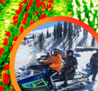
ขี่ SNOW MOBILE