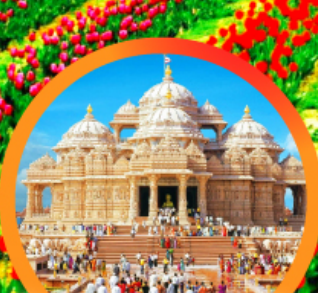
วิหารฮินดูอัชมาตี