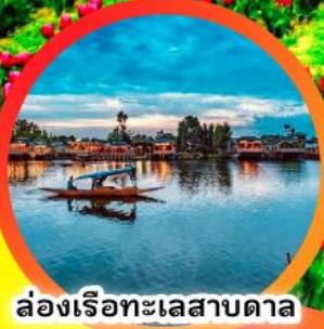
ล่องเรือทะเลสาบดาล