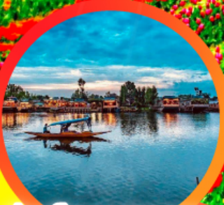
ล่องเรือทะเลสาบดาด