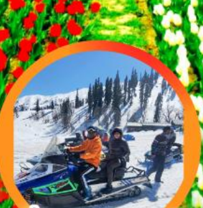
ขี่ SNOW MOBILE