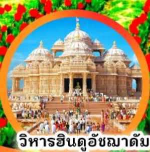
วิหารฮินดูอัชมาดัม