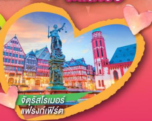
จัตุรัสโรเมอร์ แฟรงก์เฟิร์ต