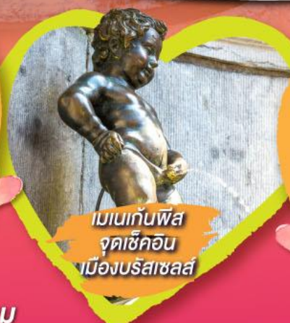
เมเนกันฟิส จุดเซ็คอน เมืองบรัสเซลส์