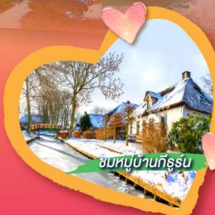
ชมหมู่บ้านกิธูรน