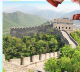
กำแพงเมืองจีนด่านจวิ๊ยกทง

Universal Beijing สนุกสุดมันส์กับธีมโลกภาพยนตร์! เต็มวัน รวมรถรับ-ส่ง