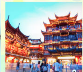
ตลาดร้อยปีเฉิงหวังเหมียว