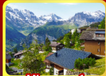
หมู่บ้านเมอร์เรน