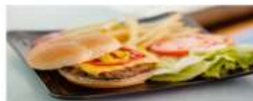
Casual Dining Savor a wide range of fresh food items and mouthwatering delicacies for dinner. View More