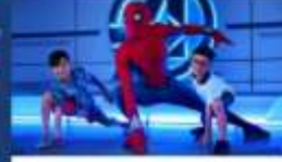
เหล่าซูเปอร์ฮีโร่และวายร้ายจากมาร์เวล