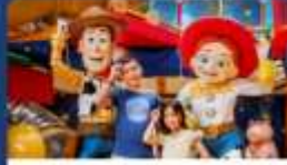
เพื่อนพิกซาร์