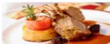
Adult-Exclusive Dining Enjoy romantic dinner destinations that cater exclusively to adults looking for fine dining amid an elegant atmosphere. View More