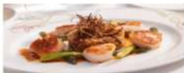
Main Dining Disney's Rotational Dining lets you "rotate" to one of 3 restaurants, while your servers follow you from venue to venue. View More