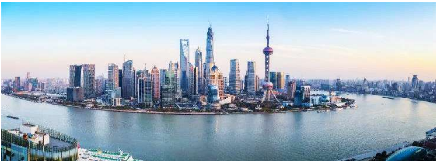
GOIPEK-CA011 ตะลอนปักกิ่ง-เซี่ยงไฮ้ Universal Studio Beijing + Shanghai Disneyland 6 วัน 4 คน โดยสายการบิน Air China (CA)

นำท่านสู่บริเวณ หาดไวทาน ตั้งอยู่บนฝั่งตะวันตกของแม่น้ำหวงผู้มีความยาวจากเหนือจรดใต้ถึง 4 กิโลเมตร ถือเป็นสัญลักษณ์ที่โดดเด่นของนครเซี่ยงไฮ้อีกทั้งถือเป็นศูนย์กลางทางการเงินการ ธนาคารที่สำคัญแห่งหนึ่งของเซี่ยงไฮ้ตลอดแนวยาวของหาดไวทานเป็นแหล่งรวมศิลปะ สถาปัตยกรรมที่หลากหลาย เช่น สถาปัตยกรรมแบบโรมันโกธิคबारอครวมทั้งการผสมผสาน ระหว่างสถาปัตยกรรมตะวันออก-ตะวันตกเป็นที่ตั้งของหน่วยงานภาครัฐเช่น กรมศุลกากร โรงแรม และสำนักงานใหญ่ของธนาคารต่างชาติเป็นต้น