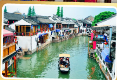
เมืองโบราณจู่เจียเจี้ยว