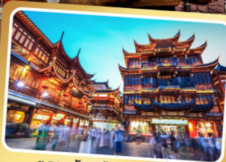
ตลาดร้อยปีเฉิงหวังเหมี่ยว