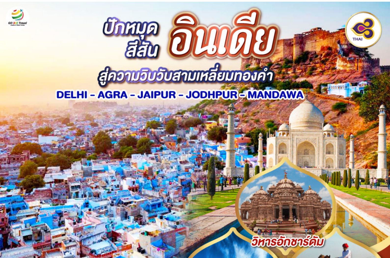
วิหารอักซาร์คัม