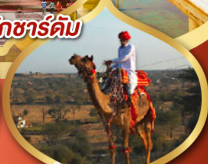
ฟรีขี่อูฐ เมืองมันทวา ราคาเริ่มต้น