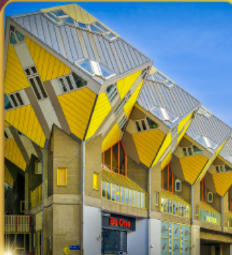
บ้านลูกเต๋า โคกคูนุส

“ล่องเรือหลังคากระจก” ชมกรุงอัมสเตอร์ดัม