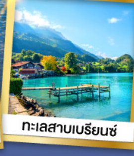
ทะเลสาบเบร์ยีนซ์