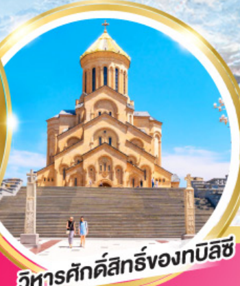
วิหารศักดิ์สิทธิ์ของทบิลีซี