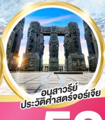
อนุสาวรีย์ ประวัติศาสตร์จอร์เจีย