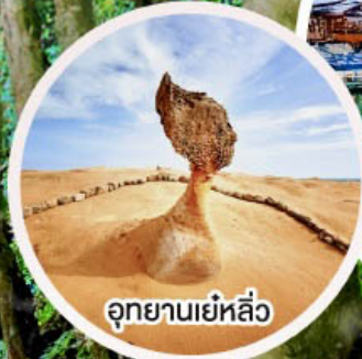
อุทยานเย่หลิว