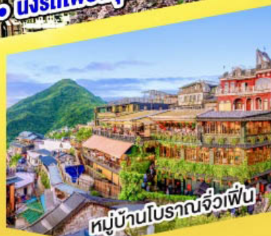
หมู่บ้านโบราณจิวเฟิ่น