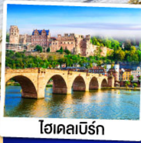
ไฮเดิลเบิร์ก