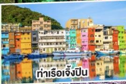
ท่าเรือเจิ้งปิ่น