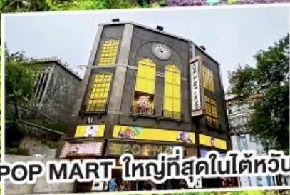
POP MART ใหญ่ที่สุดในไต้หวัน