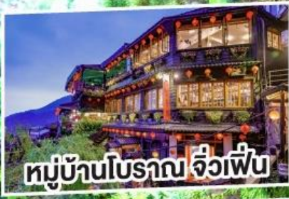
หมู่บ้านโบราณ จิวเฟิ่น