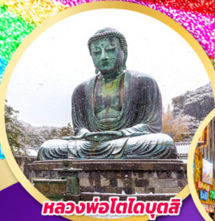
หลวงพ่อโตโดบุตสึ