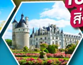
ปราสาทเชอนงโซ

เข้าชมมหาวิหารมองต์แซงต์มิเชล สิ่งมหัศจรรย์ของประเทศฝรั่งเศส