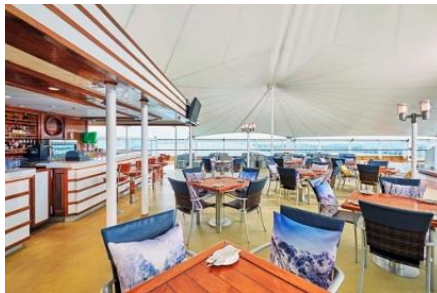
เรือล่อง น่านน้ำสากล