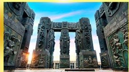
อนุสาวรีย์ประวัติศาสตร์จอร์เจีย

พิเศษ!! พัก ROOMS HOTEL ชมวิวสุดอลังการของเทือกเขาคอเคซัส