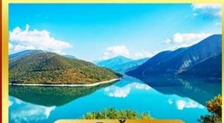
อ่างเก็บน้ำชินวาริ