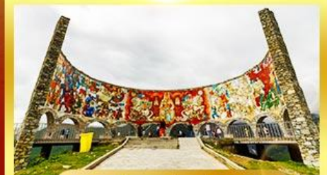
อนุสรณ์สถานรัสเซีย-จอร์เจีย

นั่งรถ 4WD ตะลุยสู่ใจกลางเทือกเขาคอเคซัส | เข้าชมวิหารศักดิ์สิทธิ์ ซามบา เที่ยวเมืองถ้ำอันเก่าแก่ อพอลิสต์ซิคห์ | พิเศษ มีอาหารไทย ณ กรุงทบิลีซี