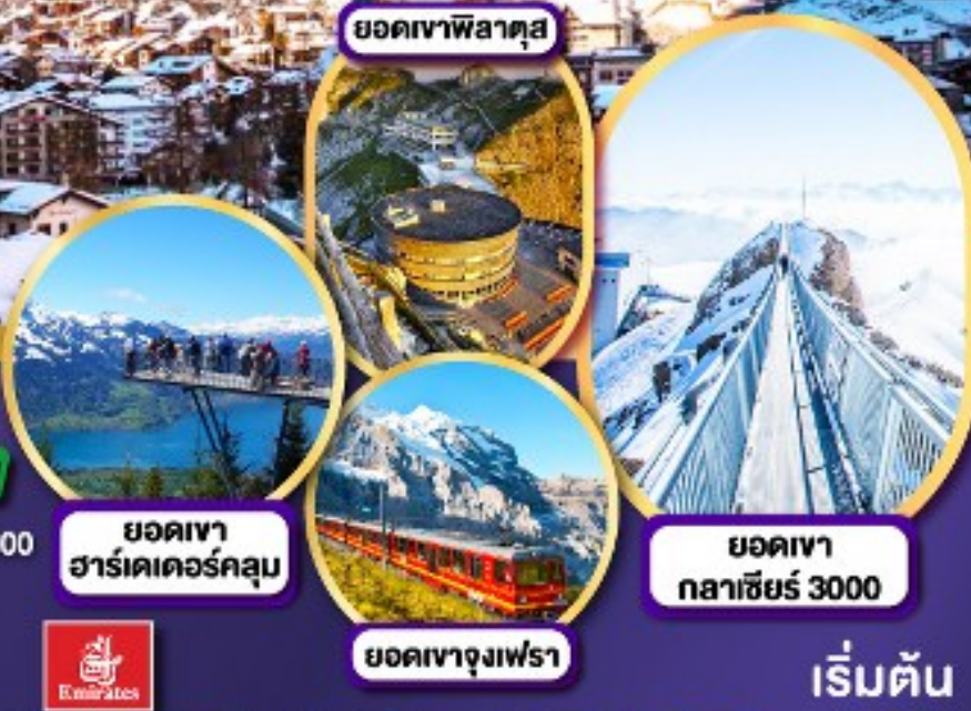
ยอดเขาฟีลาตุส