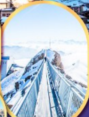
ยอดเขา กลาเซียร์ 3000