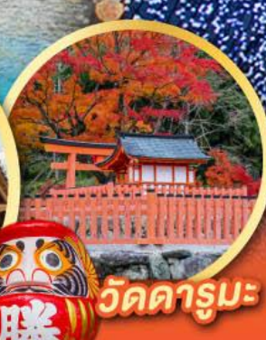
วัดคารุมะ