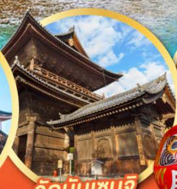
วัดนินเซนจิ