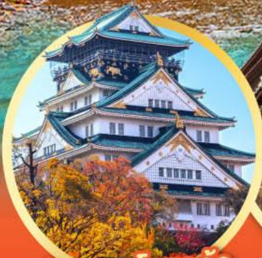
ปราสาทโอซาก้า