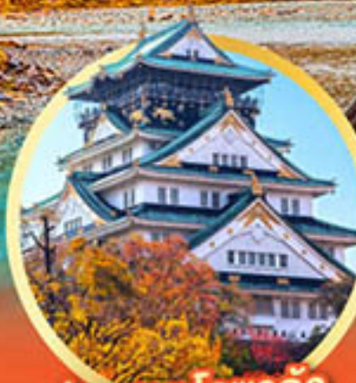
ปราสาทโอซาก้า