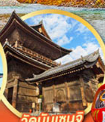
วัดนินเซินจิ