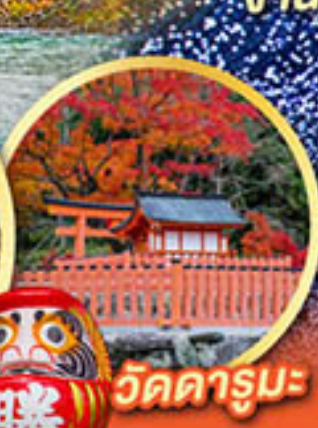
วัดคารุมะ