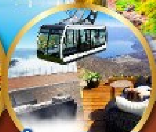
นังกระเช้าอุซุซัง

พิเศษ!! บุฟเฟ่ต์ร้าน NANDA ดีที่สุดในซัปโปโร