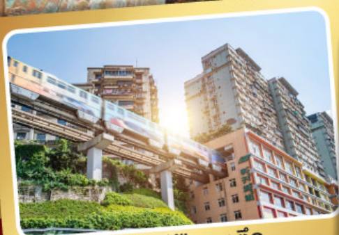
รถไฟฟ้ากระตุ๊ก

ฟรี ประกัน สุขภาพ และอุบัติเหตุ GTIP Plus (Gold Plan) คุ้มครองสูงสุด 3 ล้านบาท *เงื่อนไขเป็นไปตามที่บริษัทฯกำหนด ความคุ้มครองเป็นไปตามเงื่อนไขประกันภัย