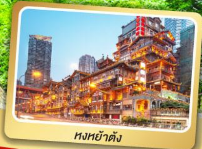
หงหย่าตัง