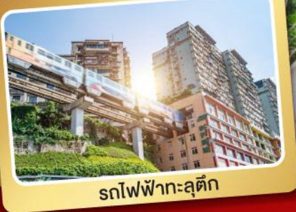
รถไฟฟ้ากะลุดัก