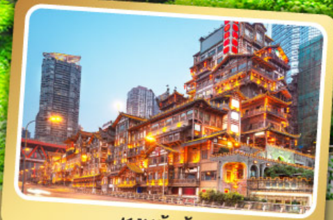
หงหย้าต้ง